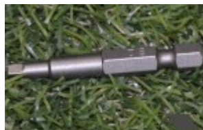
Quadr. Bit (wird mitgeliefert)