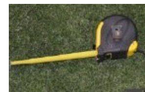
Maßband (im Lieferumfang enthalten)