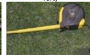
Maßband (im Lieferumfang enthalten)