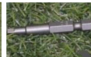
Quadr. Bit (wird mitgeliefert)